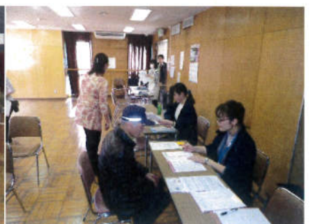
熱心に健康相談していました