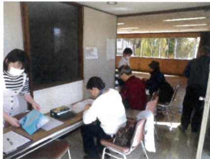
最初に、自分の健康状態を記入しました