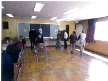
5mを普通に歩く(男性:4・4秒以内、女性:5・0秒以下)