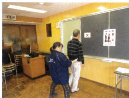
握力測定と片足開眼立ち